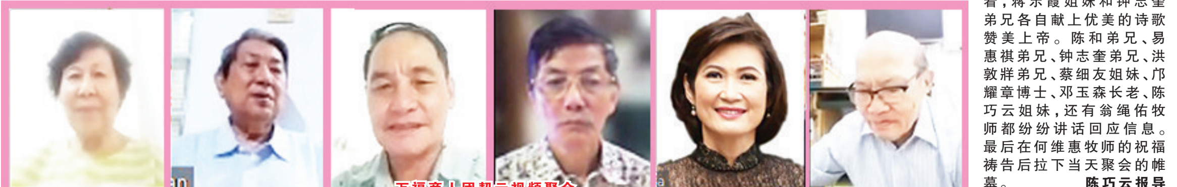
万福商人团契云视频聚会